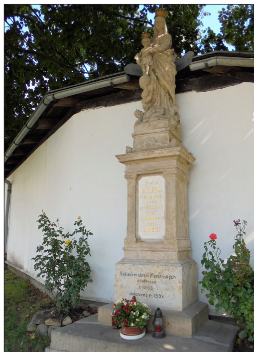
Podoba sochy Panny Marie s Ježíškem po poslední větší opravě panem Kašparem z roku 2014.