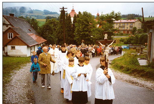
Slavné procesí z roku 1998 prochází jedním velkým staveništěm, Poniklá toho času budovala svoji kanalisaci.