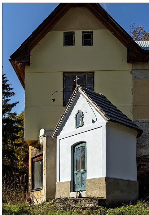
Není to skoro zázrak, když soukromý investor použije své prostředky, aby přednostně opravil svoji kapli a nikoliv svůj s ní sousedící dům?