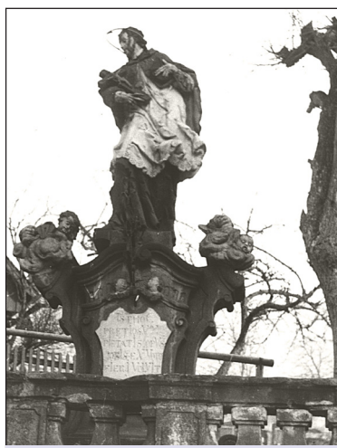
Černobílý snímek z roku 1963 dokládá, jak plně barevné dřívě sousoší bývalo.

Baroko bylo až překvapivě hravé – kdo chce, může si vylústit tajenku tak, že sečte nominální hodnoty vyzlacených liter coby latinských číslovek. Pokud barokní autor nepochybil, a pokud se nespletete ani Vy, měli byste se dopočítat letopočtu, kdy byla socha tak umně vytesána.