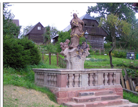
Mohutnou stavbou nepomucenského sousoší v životní velikosti vyvrcholil barokní vzmach Poniklé. Nikdy dřívě a nikdy potom nevzniklo u nás tolik umělecky zajímavého jako v letech na přelomu 17. a 18. věku. Kostel 1682, fara 1721, část kostelní výzdoby cca 1740, a konečně sv. Jan na návsi 1750. Houbeles temno!