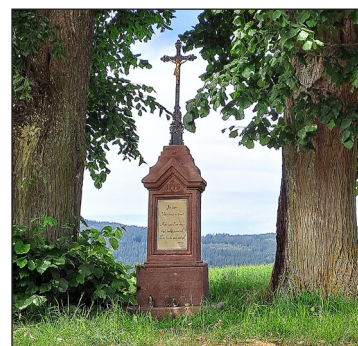
Opakovaně odlomený a vpsledku nekompletní litinový kříž byl nahrazen obdobným historickým kusem, Kristus porýzený ještě Ignácem Holubcem na něj byl přenesen.