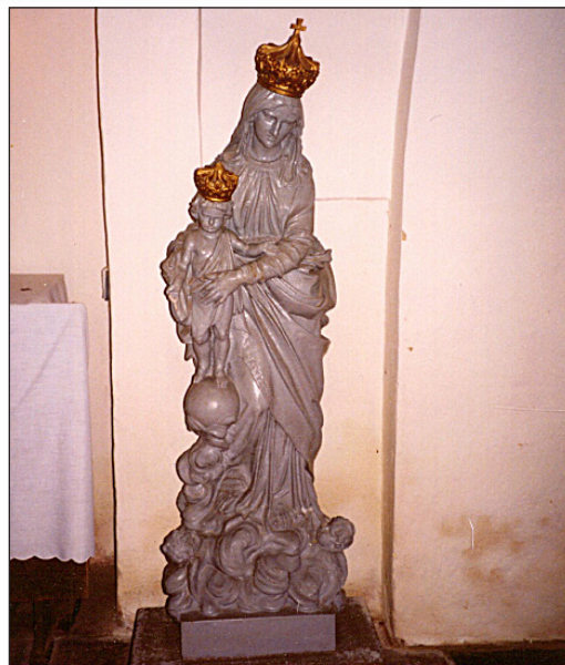
Mezi lety 1968 a 1998 nalezla na 30 let socha Panny Marie asyl v místním kostele. Natřena byla barvou, která byla před jejím návratem k farní zdi sejmuta.

Nákladem ctitelů Mariánských Postaveno r. 1908 obnoveno r. 1998