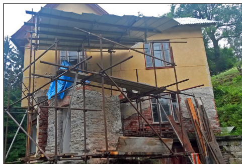
Rekonstrukce kaple v roce 2016 byla skutečně důkladná.